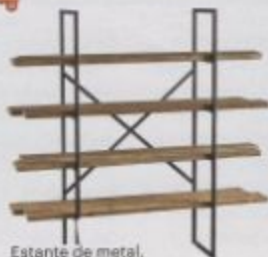
Estante de metal, 1,80 m x 0,90 m, Dialma Brown, R$ 3 770