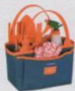
Kit Sweet Garden com 13 acessórios de jardinagem, Tramontina, R$ 171,30